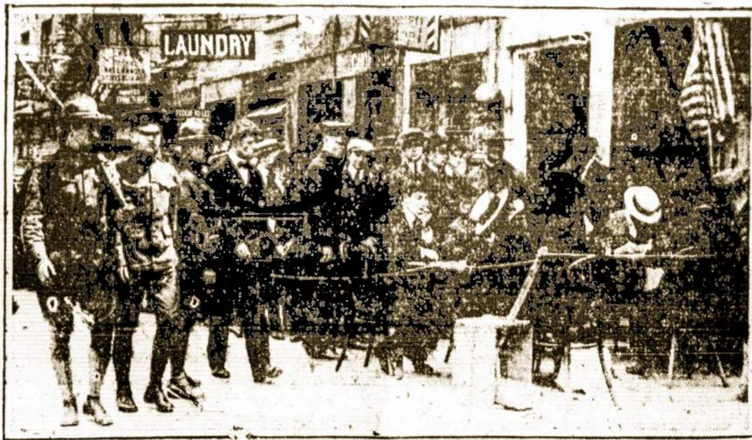
Scenos iš Suvienujų Valstijų registracijos birželio 5 dieną.

Lietuvos Dukterų dr-jos pats vardas reiškia, kad jos apart viso kitko, turi bu ti tikimosis Lietuvos Dukteri mis. Jei buti tikimosis Lietu vos dukterims, turi mylėti savo vaikus, brolius, tėvus, se nius, draugus, turi mylėti vien lietuvių tautą.