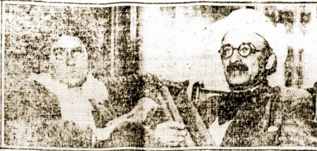
Emma Goldman ir A. Berkman, anarchistai. Jiedu sedi kalėjime už agitacija prieš konskripcija.