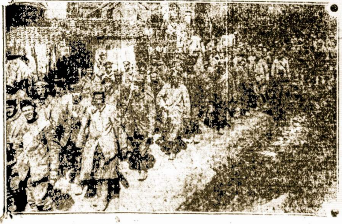
Kanadiečių suimtieji belaisvėn vokiečiai kareiviai tolyn nuo mušio laukų varomi.