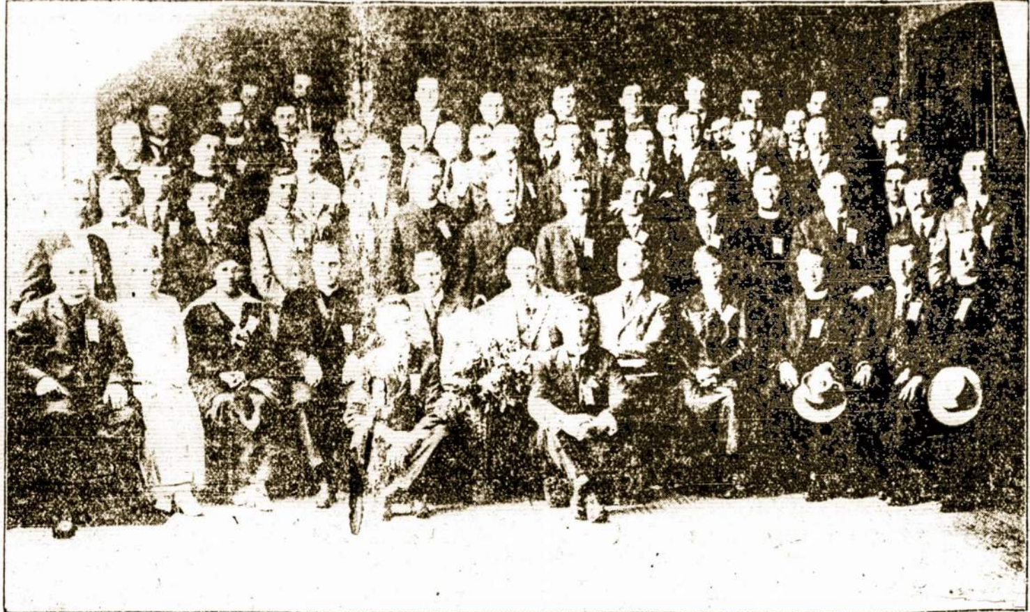
SUSIVIENIJIMO LIETUVIŲ R. KAT. AMERIKOJE 32 RO SEIMO, PITTSBURGH, PA., ATSTOVAI.