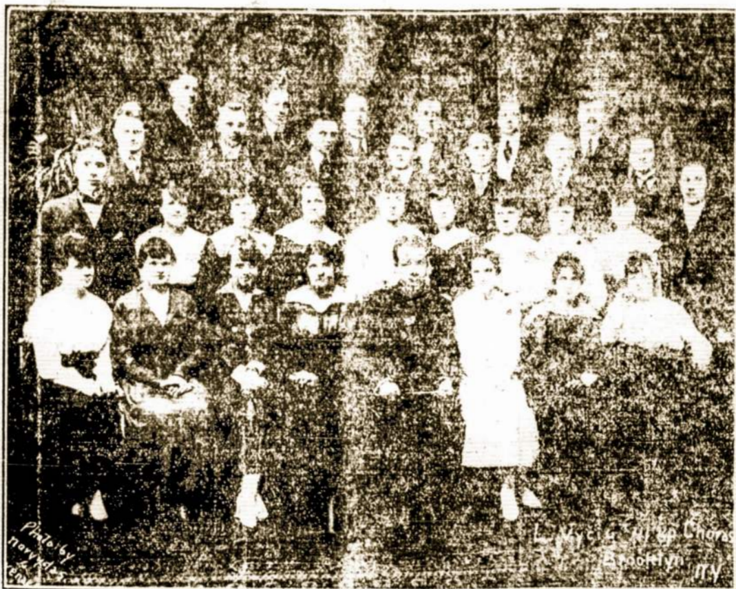
Buvęs Liet. Vyčių 41 kuopos choras, Brooklyn, N. Y., liepos 5 d. susirinkime likviduotas. Per didelius vargus pagimdytas, prie abelo kuopos narių, jo prietelių ir jo nepamegusiųjų nervų suirimo pala dotas. Nesupratimo ir asmeniškų tenden-cijų auka. Lauksime tų geresnių aplinkybių, kuomet atgimęs choras patsai užgiedos: "Resurrexit".

ateityje padarys. Bet ką ges-gijos reikalus. Čionykščia-ro ikišiol padarė? Antra, kad ką gero atsiekti, nėra miestelyje buvo susivėrusi reikalo griauti. Darbinin-kamas reikia i geras organi-zacijas spiešius ir tuomet ga-lės prieš išnaudotojus pasi-statyti. Budanj bedievišais, socialistai neturi nė Dievo, nė artimo meilės, nori vien keraujo praliejimo. Kad pas- žmones prigytų kiek katali-kiškas tikėjimas ir artimo meilė, ant žemės geresnis ro-jus butų, negu ką socialistai žada. Nebut nė vagsyčių, nė kravinių revoliucijų, nė lais-vos meilės, ką socializmas gimdo.