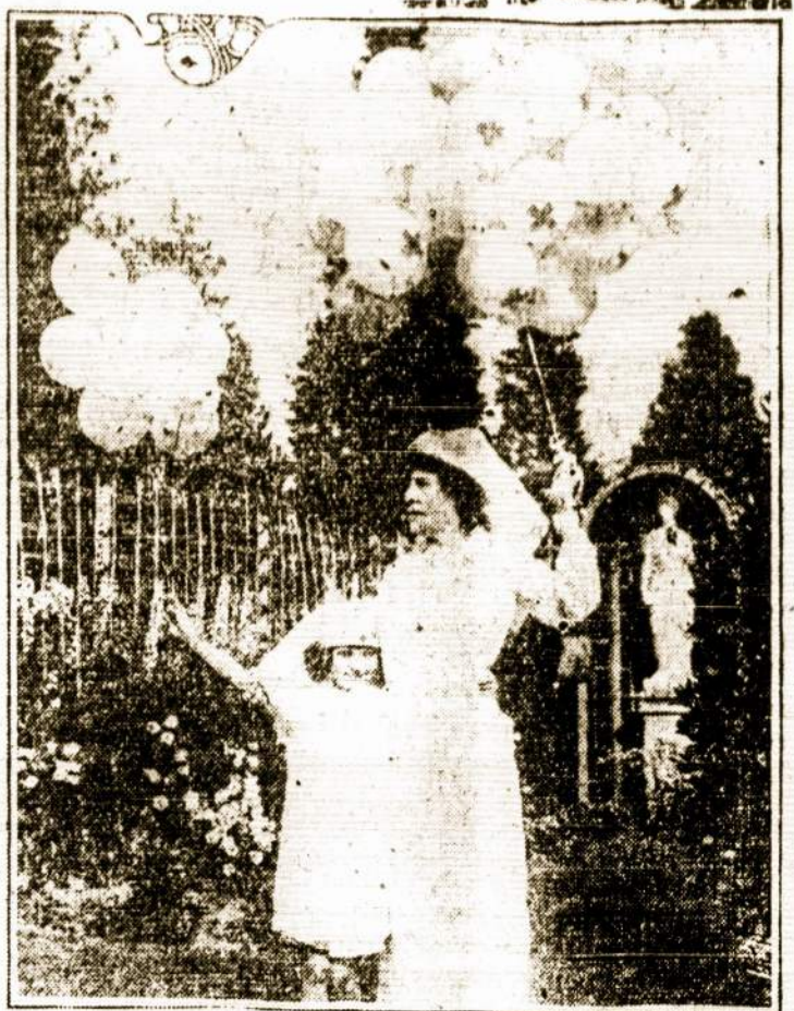
Raudonajam Amerikos Kryžiui aukos visokiais būdais renkamos. Ant paveikslėlio matome vieną moterį turtuolę, užsiėmusią "balionų" pardavinėjimu Raudonojo Kryžiaus naudai.

Prie palaikymo gero uopo delegatuose svarbiusiu prisidėjo gera tvarka Cent-