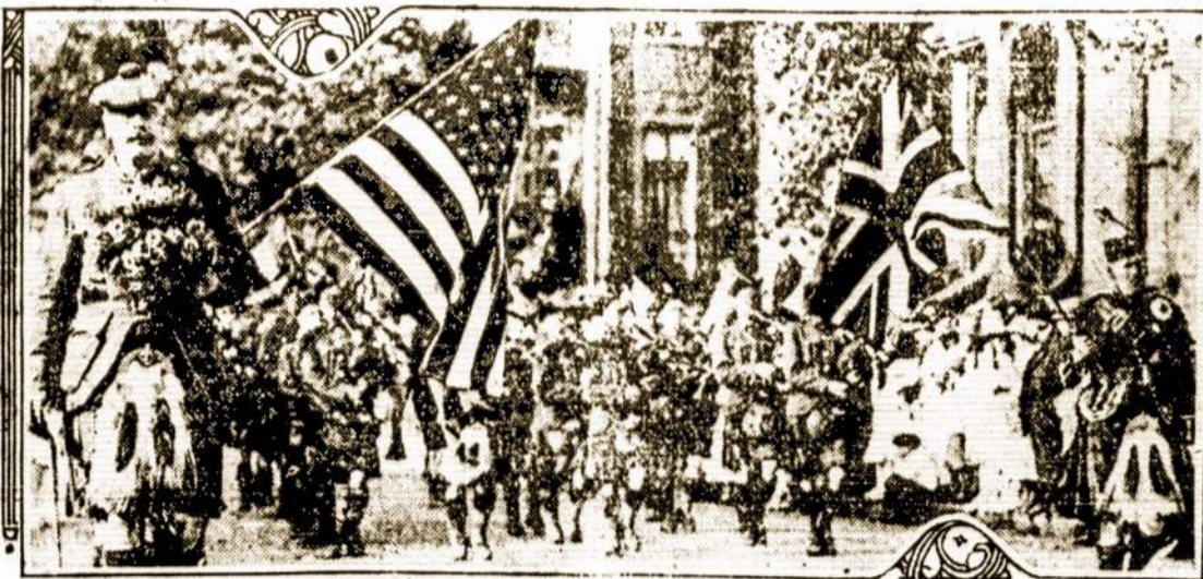
Kad paskatinti Amerikoj anglų ir Anglijos armijas rekrutavimą, Kanados valdžia Amerikon atsiantę škotų kompaniją. Jų išviso atsiantė 200. Tautiškais škotų rubais pasirėdė, matome juos Amerikos miesto gatve maršuojant.

Nedėdienyje, rugpjūčio 5 dieną, š. m., vietinė lietuvių parajija rengiasi prie