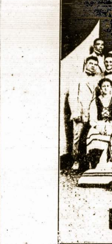
Sis naujai suorganizuotas, skaitlingas ir simpatiškas L. Vyčių 79 kuopos, Detroit, Mich., choras rengia gražū koncertą 8 rugsėjo dieną, sv. Jurgio parap. salėje, Detroit, Mich.

Kornilovas slėpėsi dienomis, nakvojo laukuose, miškuose, urvuose, kur pilna vilkū, meškū. Lipo per akmenotus kalnus, plaukė per leduotas upes, nuo visos sargybū eilės išsisukdamas. Bado kankinamas, visiškai sumenkėjęs, betgi galutinai pasisekė rusū linijas. Laik-