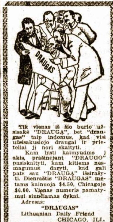
„DRAUGAS“ Lithuanian Daily Friend CHICAGO, ILL.