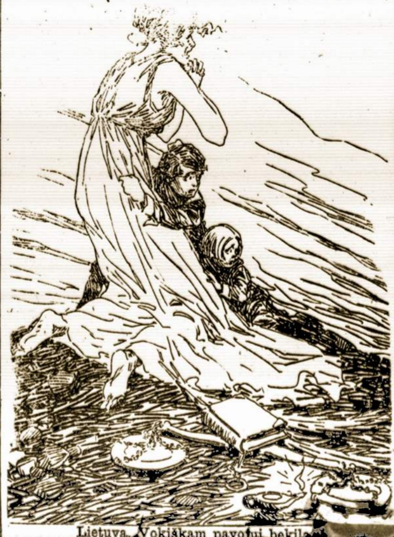
Lietuva. Vokiškam pavojui bėgti.

True translation filed with the Postmaster of Brooklyn, N. Y., on April 23, 1918, as required by the Act of October 6, 1917. OLANDIJA BIJO VOKIEČIŲ UŽPLUDIMO. London, bal. 22.— Daily News praneša, jog užrubežio ministerija sužinojusi, kad santikiai tarp Olandijos