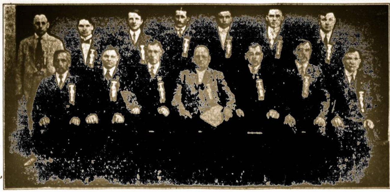
Susiv. Liet. R. K. Am. 190 kuopa (šv. Kazimiero Kareivių Draugija), Detroit, Mich.