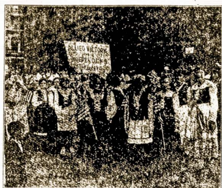
Buryis Lietuvių Didžiojo New Yorko Paradoje, Liepos 4d., 1918 m.

visose Amerikos lietuvių kolonijose rengti: 1) Rimtas paskaitas; 2) Prakalbas; 3) Teatras ir prakalbas; 4) Geras budas yra gauti magišką lėmpą arba kruta- nuosius paveiklus, kurie perstato šeimynų skurdą iš prieštasties prie organizacijų neprigulėjimo, kurios teikia pašalpą, ir rodyti žmonėms; 5) Vaikščioti po namus ir prirašinėti prie Sus-mo; 6) Platinti literatūrą apie apdraudą, ypatinai S. L. R. K. A. raštininko brošiūrėlę; 7) Organizuoti kuopas, ka- me jų dar nėra. Yra ir daugiau įvairių bu- dų. Visus negi išskaitliuosī. Visi S. L. R. K. A. nariai per "Apdraudos Savaitę" dirbkime. Prie kiekvienos progos neprisirąšiusijį kal- binkime tapti brangios or- ganizacijos nariu. Ruoskimės, nes didelis dar- bas mūsų laukia. Šilas.