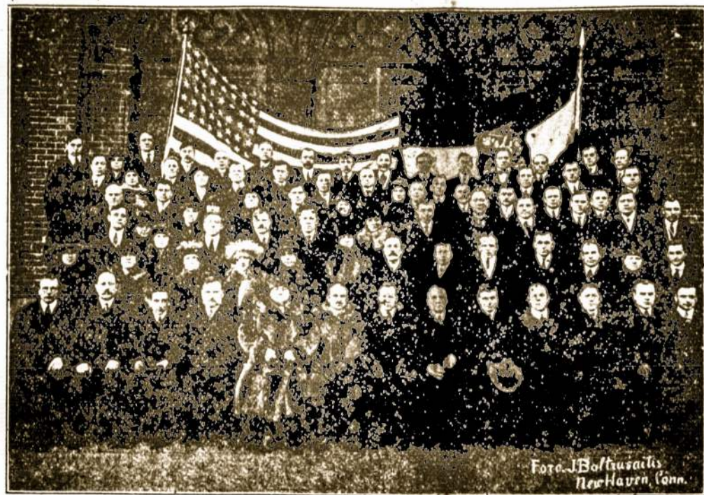
New Haven, Conn. lietuvių burvas, kurie "Laisvės Savaitėje" Lietuvos reikalams aukavo po $50.00 ir augščiau.