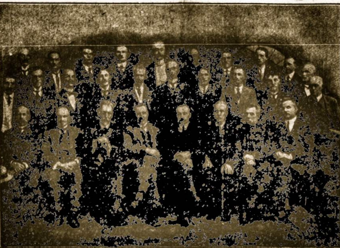
Bankų ir kredito įstaigų suvažiavimas Kaune, spalij mėn., 1919 m. Viduryje sėdžia buvęs ministė- ris pirmininkas šleževičius ir buvęs finansų ministeris J. Vileičis.