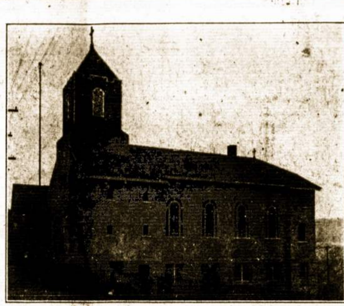
SV. JONO LIETUVIŲ BAŽNYČIA, COALDALE, PA.

LONDONAS, ANGLIJA. Mūsų, lietuvių, parapija, vis po truputį maža. Tas atlety gali pa-daryti parapijos išde žymę. Visi veiki išvažiuoja Lietuvon. Tečiaus žimtais neišvažiuoja, bet pas mus apsigyvenusių lietuvių, galima sa-kyti, nėra didelis skaičius. Nežinia, ar kada lietuvių jeteigis klubių? Man rodos, ne. Darbai ma-žai ką pagerėjo. Kad ir pagerėjo, tai ne prie visų, tik prie kai kurių. Čia gal darbus pakenkia ir išti-kusis angliškųjų streikas. Teko sužinoti, kad per Londoną daug