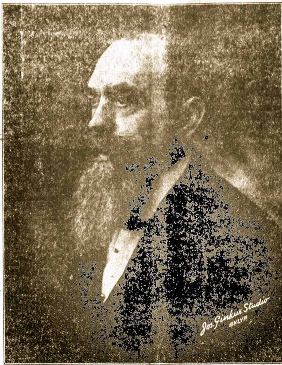
KOMPOZITORIUS JUOZAS NAUJALIS, kurs atvyko Amerikos lietuviams koncertų duoti. Pirmas jo koncertas bus vasario 22 d., McCaddin salėj, Brooklyn, N. Y.

Šio mėnesio 16 d. šioliktą die- ną rengiamės suvažiuoti