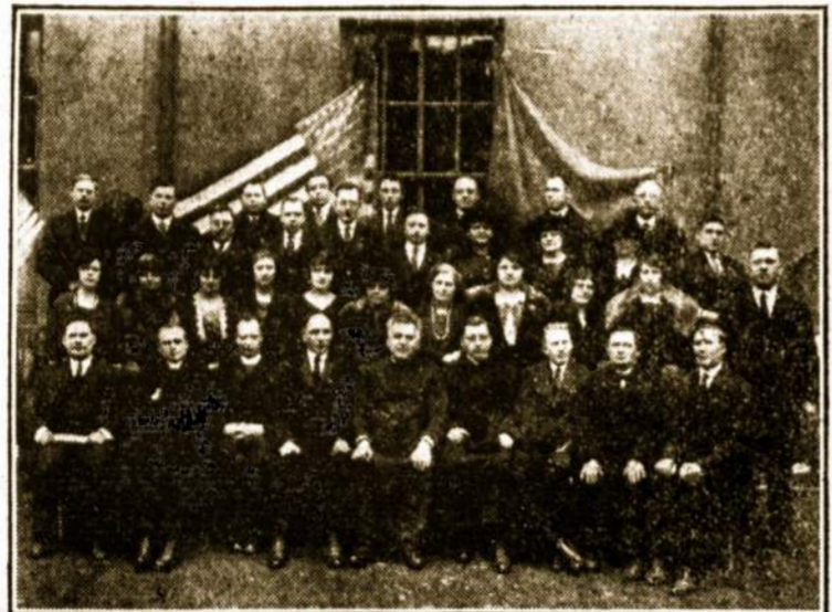
PHILADELPHIJOS LIETUVIŲ KRIKŠČIONIŲ SĄRYSIS.