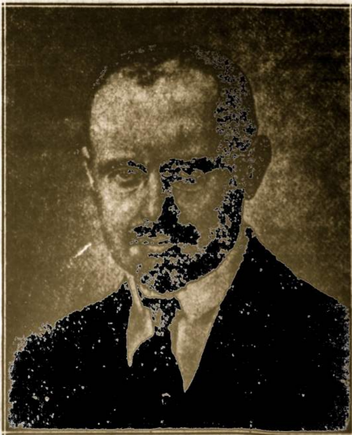
ANTANAS STULGINSKAS, Lietuvos prezidentas.

Pripažinus Pabaltijos valstybes, Suv. Valstijos formaliai priima ir buferinių valstijų sistemą, kurią Rusija atidalinama nuo vakarinės Europos. Ton sistemon ineina: Suomija, Estonija, Latvija, Lietuva ir Lenkija.