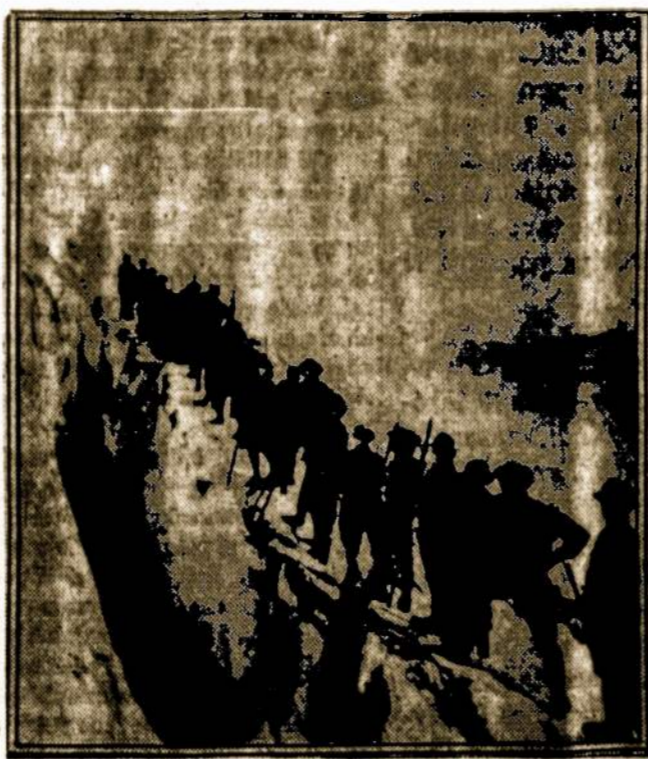
Lipa kalnan Rainier National parke. Tų taurisų priesakų yra duobė 200 pėdų gilumo.

1921 metais. 43. Kovo 12 d. East Side Did. L. Kunigaikščio Gedimino Skolimo ir Budavojimo Draugija, Chicago, Ill. (Komiteto laiškas iš 1921 m. sausio mėnesio 10 dienos) perduoti "Geležiniam Vilkiui" ... 4,200.