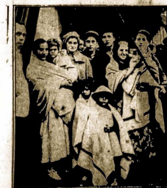
Išgelbėtieji nuo nuskendusio spanų laivo "Hamonia".

Turiu priminti, kad čia gerai gyvena S. L. R. K. A. 131' kp. Norintieji prisirašyti ateikit į susirinkimą, kurie laikomi kas pirmą, kas yra palikta metiniam susirinkimui.