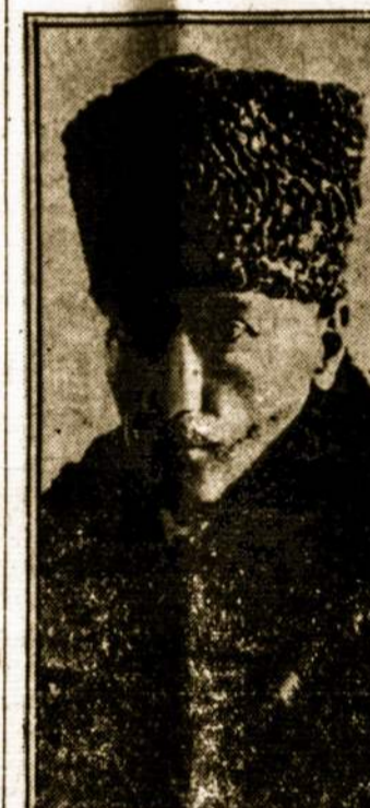
Mustapha Kemal Pasha, turkų nacionalistų vadas, kuris užėmė Smyrną ir kurio kariuomenė graso nauju karu.

Smyrna. — Užėmus šį miestą turkams, prasidėjo kruvinos skerdynės. Turkai be jokio pasigailėjimo skerdė ir tebeskerdžia krikščionis. Paskutiniųjų tukstančiai, viską palikę, bėga iš miesto. Nekuriuos šelpimo organizacijos išvežė iš miesto ir sušelpė, bet tukstančiai miršta badu. Tris savaites vyrnai, moterys ir vaikai gyvena šalygatviuose. Juos turkai persekioja, kankina, plėšia. Išbadėje, įvargę žmonės lygsvaros nustojo: vieni, sakoma, nusižudo, kiti desperatiškai plaukus sau nuo galvos rauja. Vyrnai, kurie tikė vietą užėmė jo sunus princas Jurgis. Žmonės ir iš to nepatenkinti, reikalauja respublikos. Norima grąžinti buvusis premieras Venizelos, respublikos šalininkas.