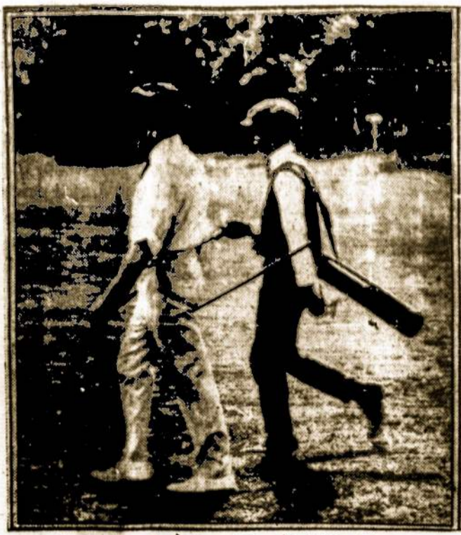
Generolas J. J. Pershing žaidžia "golf".

KAUNAS. Š. m. rugsėjo 9 dieną prieš pietus labai malonų ir visai Lietuvai pasididžiuojantį įspudį darė Laisvės alejoje Lietuvos maldininkų, vykstančių iš Kauno Sidlavon, eilėna. Bent pora alejos kvarčiau buvo užkimšta žmoniėmis. Ištisa senų ir jaunų moterėlių, mergaičių, vyrų minia, krepšėlius, maišelius su maistu nesina slinko nuo Katedros, stoties link. Ėjo su pilna bažnyčios procesija, nešė baltai pasipuošusios mergaitės vėliavas, altorėlius ir žibintuvus. Procesijos gale ėjo choras giedodamas vieną giesmės punktą, orkestras, Kaunas, 1922, rugs. 9 d. Ilgėsys.