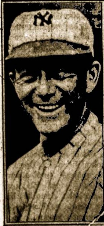
Miller Huggins, svaidininkų "Yankees" lyderis.