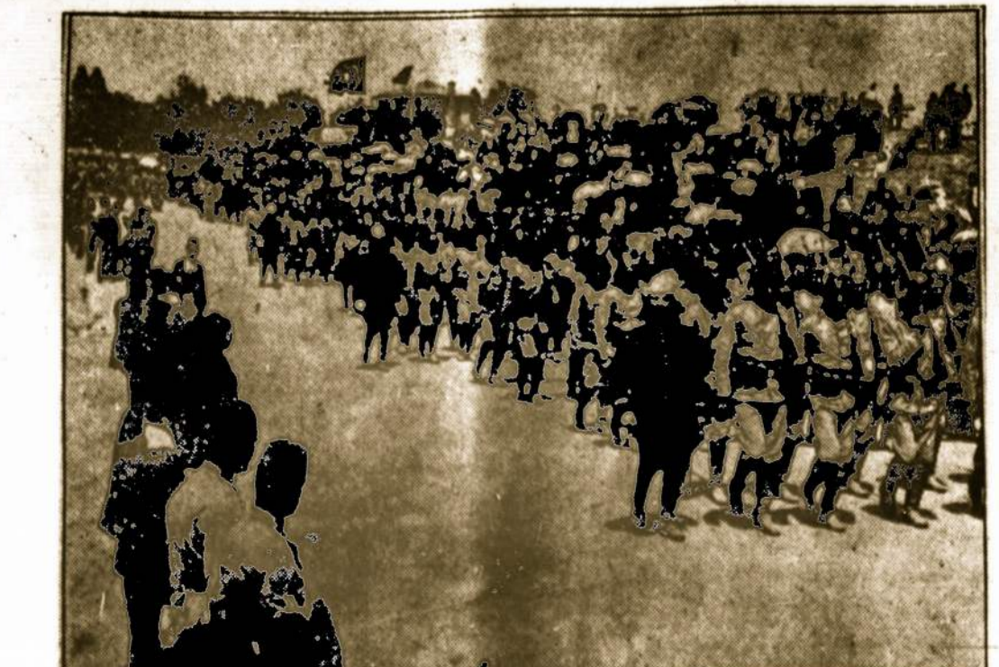
Narsus turkų kariuomenės pėstininkų pulkas. Turkų kariuomenė vis artyn eina prie Dardanellu. Alijantai daro nuolaidų, atiduoda jiems visą Trakiją, kad tik turkai neitų toliau.