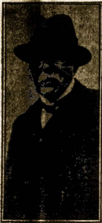
Jurgis Clemenceau, buvusis Prancijos premieras, dabar važinėja po Jungtinių Valstijų miestus sakdamas prakalbas.

Berlynas. — Vokiečių minia užtakavo alijantų kontrolės komisiją, kuri vyko Ingolstadt, Bavarijion, tyrinėti ar nedirbama amunicijos. Vienas Anglijos kariūninkas sužeistas.