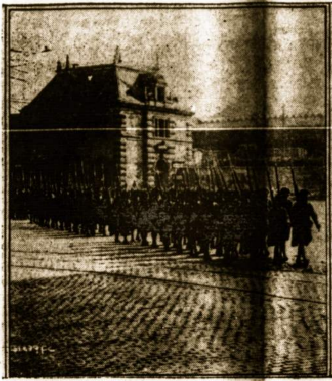
Pilnai apsiginklavusi francūzų kariuomenė įeina į Ruhr apskritį, Vokietijos teritorija.

Kaunas, Lietuva, sausio 18 d. — Lietuvos premieras, E. Galvanauskas, pareiškė parlamentui, kad Lietuva nepriims Ambasadorių Tarybos nuosprendžio Klaipėdos klausimu, jei jįsai bus priešais Klaipėdos krašto gyventojų valią. Laikraščiai sako, kad valdžia atsisakys pripažinti alijantų valdžią Klaipėdoj.