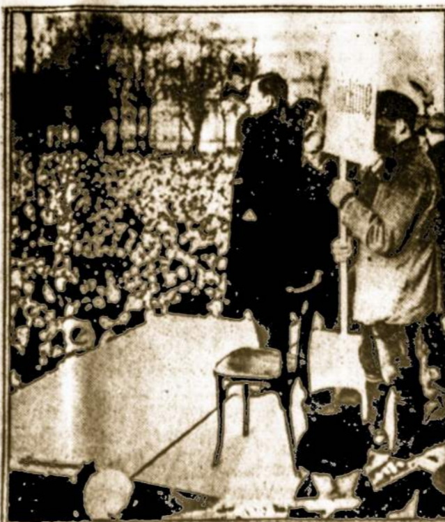
Vokiečių protesto mitingas Berlyne del francuzų įsiveržimo Vokietijon.

Vašingtonas, sausio 30 d. (L. I. B.) Komisija pareikalavo Klaipėdos sukilėlius nusiginkluoti. Direktija pra-nešė, skaito tą reikalavimą paliaubų sutarties laužymu. Kare laivų matrosai supirkinėja mieste daugybės produktų, matyti spekuliacijos tikslams. Direktija priversta uždrausti tas karo laivų operacijas. (Elta)