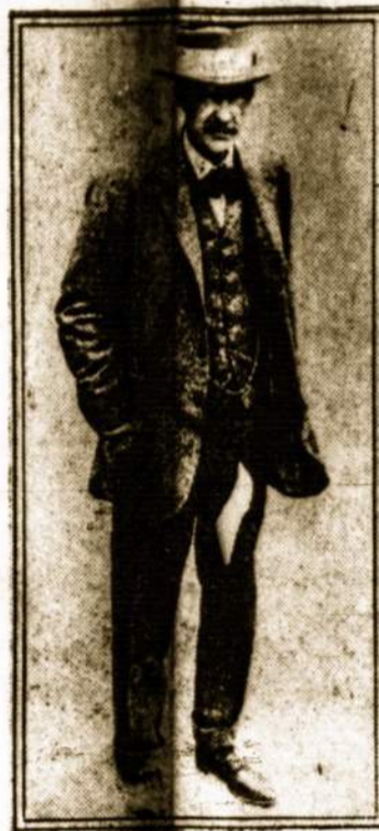
Lordas Canarvon, faraono Tut-Ankh-Amen liekanų Egipte atradėjas, kuris gavo kraujo užsinuodijimą ir mirties.

Vašingtonas. — Senatorius Wadsworth reikalauja apginkluoti Panamos kanalą.