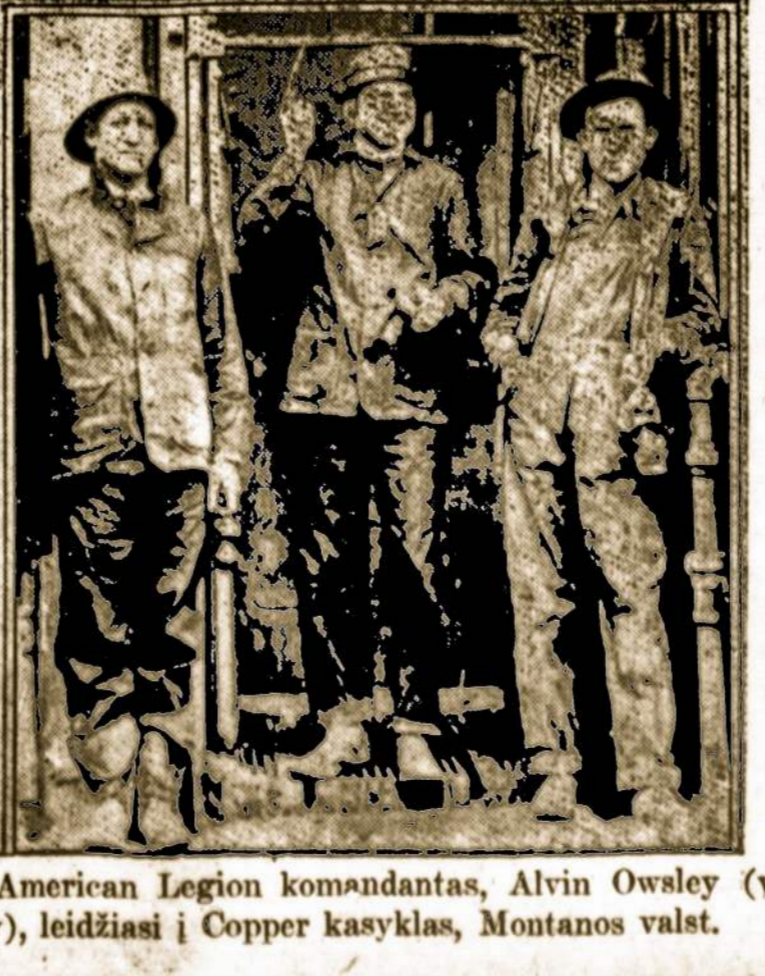
American Legion komandantas, Alvin Owsley (vidury), leidžiasi į Copper kasyklas, Montanos valst.

Šis miestelis yra nedidelis, apie 5,000 gyventojų visokių tautų, lietuvių 7 šeimynos gyvena, bet lietuviai gyvena kituose miestuose.