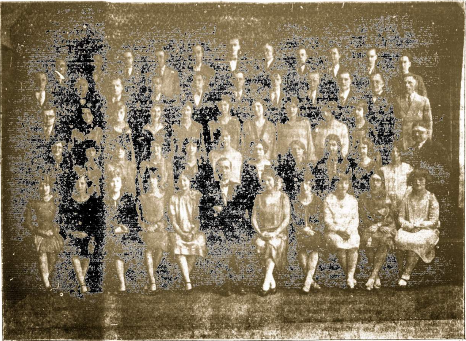
LIET. VYČIŲ 25 KP. KORAS, CLEVELAND, OHIO.

"Aš lydima savo draugės, leidau si kelionėn. Mes buvome pasiėmę mūlą, ant kurio, nūgaros buvo du krepšiai. Viename krepšyje buvau įdėjusi savo Jokūbiukę, o kitame krepšyje buvo kitas mano kūdikis — juodviečių viduryje jojo dešimties metų berniukas. Kelionė puikiai sekėsi. Buvo sėkmingas; mes įėjom bažnyčion — klebonas sakė pamokslą. Aš su savo kūdikiais stovėdariau sėdynėse. Jokūbaitė pasisodinau tarp manęs ir jos broliuko; mudu abu kreipėva į ją domės. Prasidėjo Mišios. Kada atėjo "Sanctus" Jokūbiukė garsiai susuko; aš pati girdėjau braskėjimą, tarsi kaulai būtų vienas į kitą trina mi. Kas tada darėsi su manimi, to aš nestengiu nupasakoti. Dingtelėjo mintis; mano kūdikis jau išgydytas; ši mintis atėjo taip netikėtai — aš nūdžingau. Kada atėjo "Komunija", aš savo vaikūniui liepiau gerai saugoti mergaitę. Paskui aš prisiaurtinai prie Viešpaties Šalio. Kada aš atsiklaupiau, o mano Dieve! Jokūbiukė išsijuko iš savo brolio ir atbėgus pas mane atsiklaupė. Aš taip labai nustebau, kad net samonės nustoju. Aš daryju klebonui ženklą, kad jinai kūdikįj neduotų komunijos ir sugrįžau į savo vietą, o kūdikis sekė paskui mane. Aš vėl jį pasodinau suolan, bet laikyti jo jau neberekėjo. Jėsa kojos