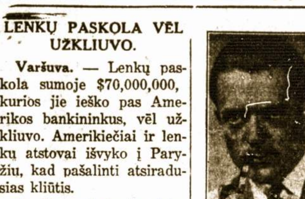
RAPOLAS KRUCH'AS Fotografas

65-23 Grand Ave., Maspeth, L. I. Telephone JUNIPER 7646