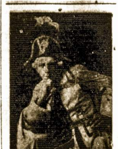
ART. ST. PILKA.

Garsus Liet. Valst. Teatro artistas, kuris su dideliu pasisekimu veikia Amerikoje. Vieninteli kartą dalyvavo "dizmidzimdirziskioj" komedijoj "Zemės Rojus".