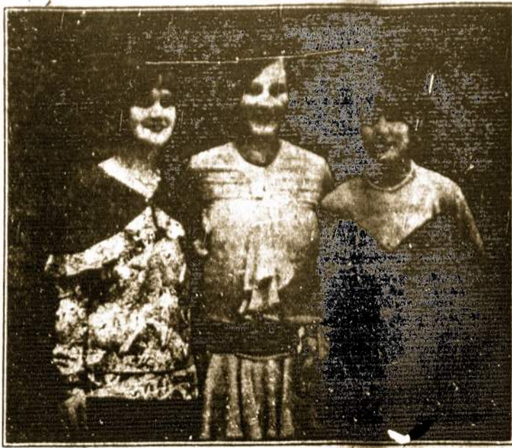
NEWARK, N. J. GRAŽUOLĖS.

Iškilmes rengia ir visus nuoširdžiai kviečia FERRACIJOS APSKRITIS.