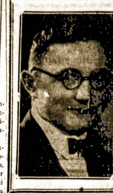
TEL. KINGSTON 3069.

ta, padainuota, pašokta prie garinių gėrimų ir užkandžių. Choras ir jo vadas muz. Stulgaitis labai gražiai sugyvena ir todėl vieni antrų pastangas labai įvertina.