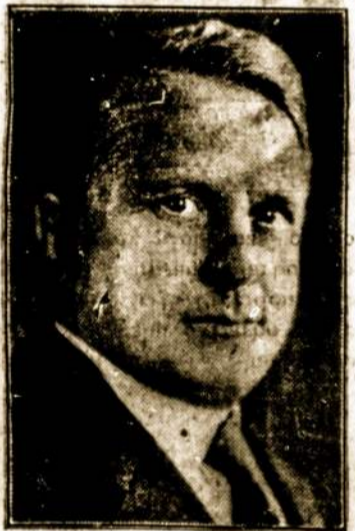
JAMES J. DAVIS, kandidatas į U. S. Senatorių

Mr. Davis, kurs pradėjo savo pragyvenimo darbą Sharon, Pa dirbtuvėje, išbuvo Darbo Sekretorium prie trijų Prezidentų kabinety. Jis supranta darbo žmonių ir ateivių problemas, del to