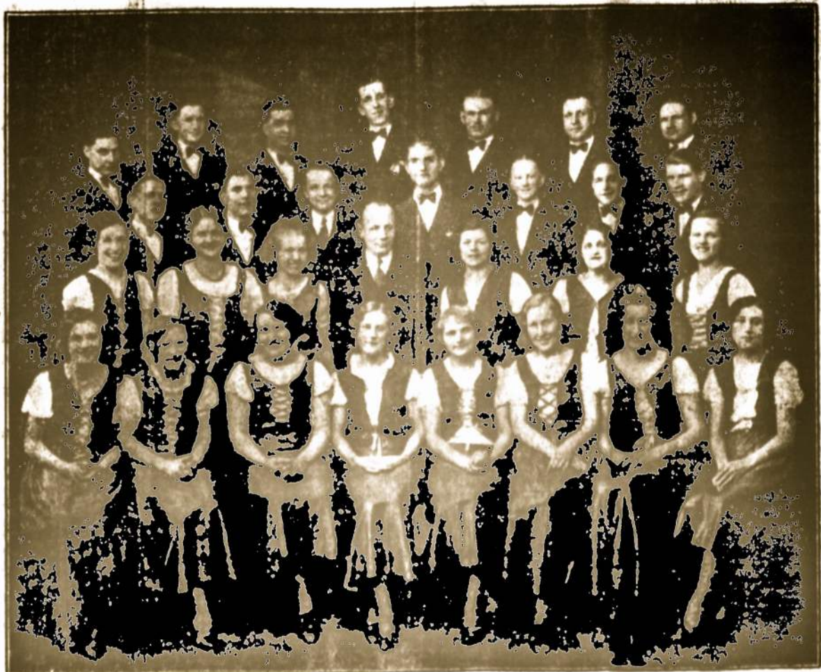
WATERBURY, CONN. ŠV. JUOZAPO PAR. CHORO VAIDILU GRUPE. kuri 3 m. kovo 13-tą važiuoja į Hartford, Conn. suvaidint operetę "Sylvia" Vakara rengia LRKSA. 89 kp. LDS. 6-ta kuopa ir Moterų Sąjungos 17-ta kuopa