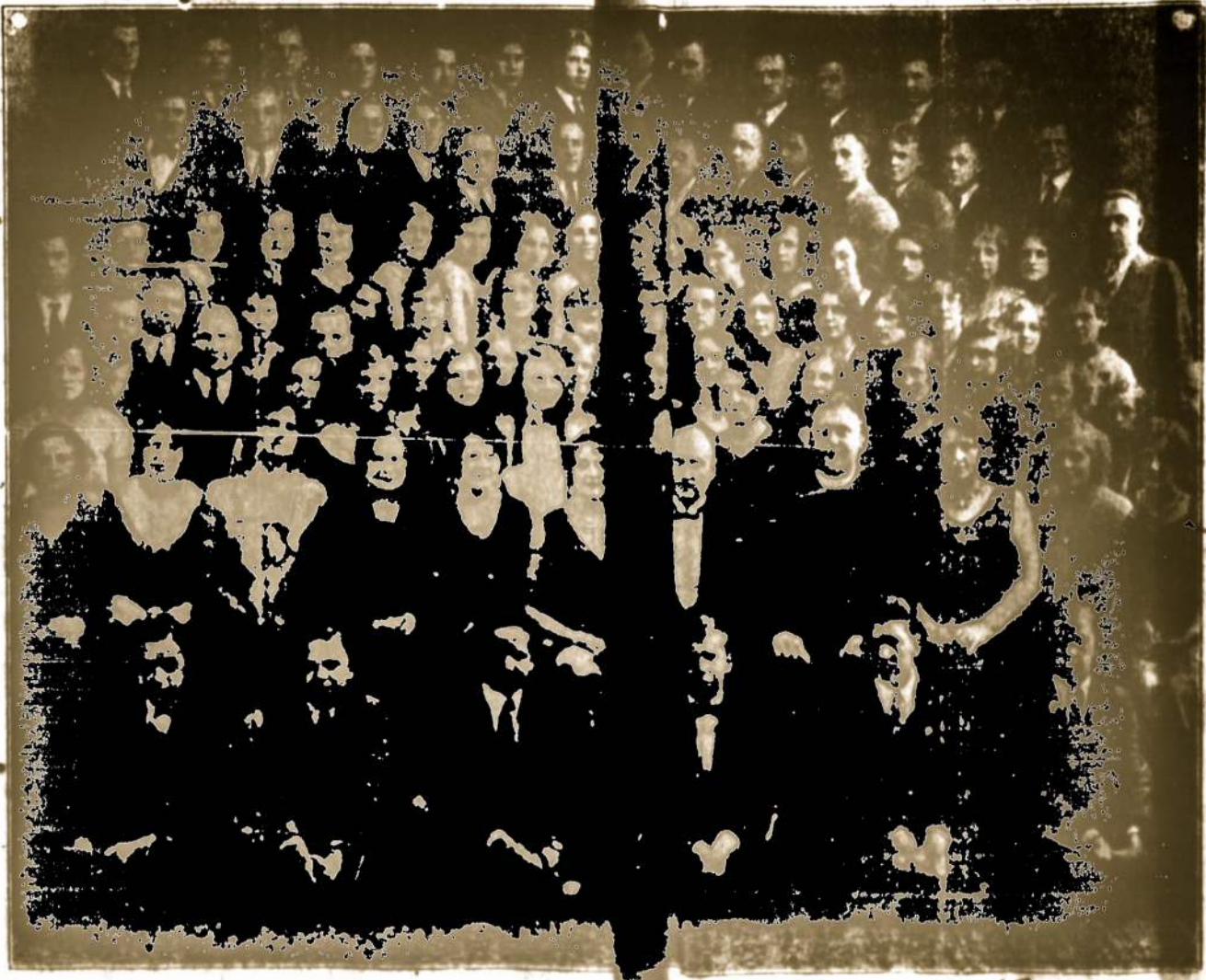
DETROIT, MICH., SV. JURGIO PARAPIJOS CHORAS Sekundinio balandžio 3-ąją, 4:30 val. po pietų Lietuvių Be... J. Čižauskui, statys scenoj operetę "KAMINAKRĖTYS IR..." viena eilė įvyomiausių solistų.

Reikalaukite nuo savo agento laivakortės ant SCANDINAVIAN AMERICAN LINE 27 Whitehall St., New York City 248 Wash. St., Boston, Mass. 130 No. La Salle St., Chicago