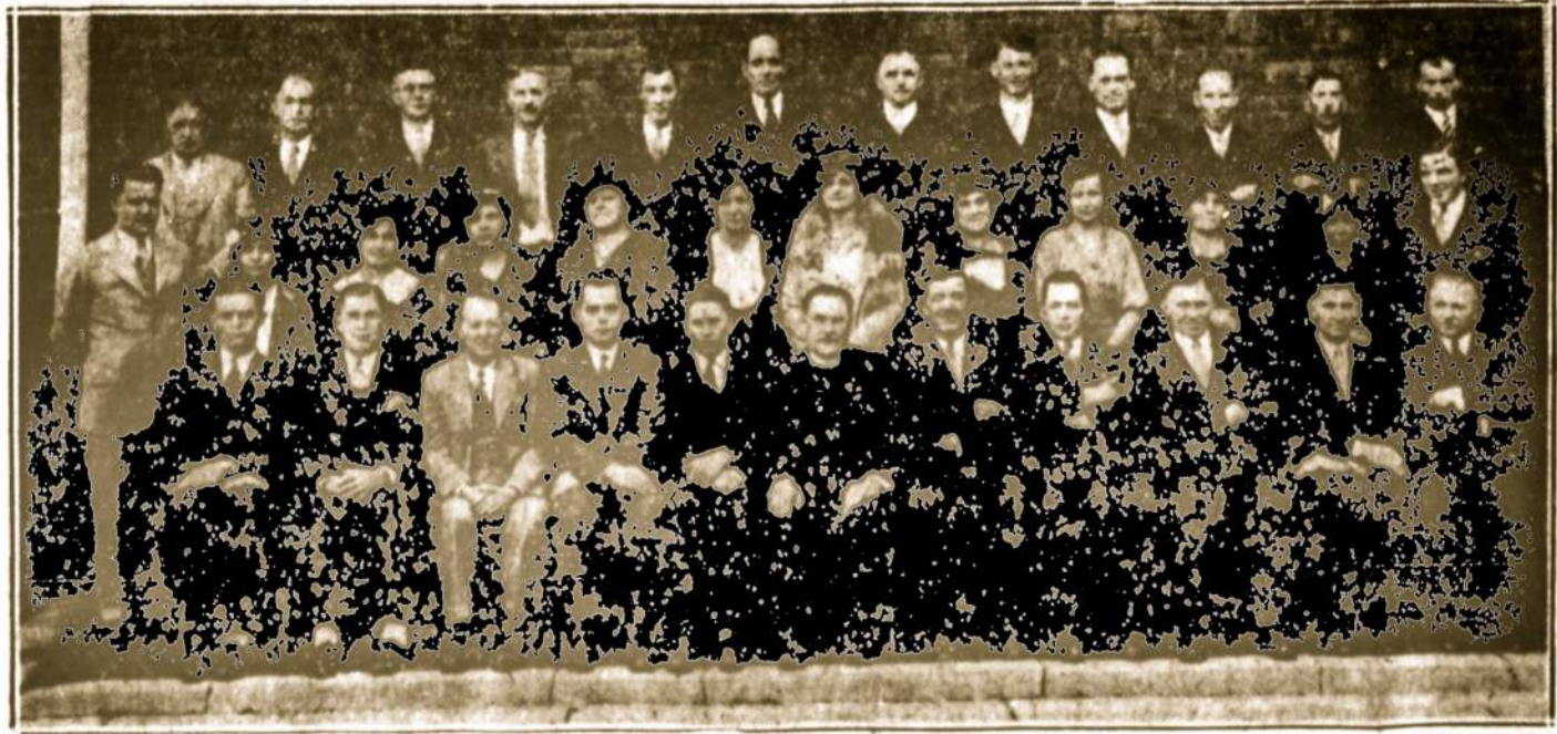
SV. MARIJOS LIETUVIŲ PARAPIJOS, KINGSTON, PA., 30 METŲ JUBILIEJAUS MINEJIMO KOMITETAS (Jubiliejiaus iškilmės įvyksta šių metų spalio 29—30)

Platesnė parapijos įsteigimo istorija ir jos vystymasis bus išaiškintas pirmųjų parapijos steigėjų jubiliej-i-niuose parengimuose spalio 29-30, ir bus paduota laikrašty.