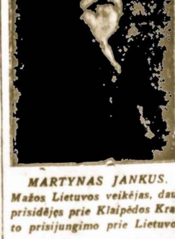
MARTYNAS JANKUS. Mažos Lietuvos veikėjas, daug prisidėjęs prie Klaipėdos Krašto prisijungimo prie Lietuvos.

Todėl, reikia pripažinti, atme-tant vokiečių naują pažiūrą, kad pagal archeologijos davinius, dar tautų kraustymosi metu Klaipėdos krašte ir anapus Ne-muno gyveno lietuviai. Tai pa-tvirtina kronikos ir lietuviškų vietovių vardai. Iš šios trumpo- apžvalgos matyti kokius melus vokiečiai platina apie mūsų pra-eitį nešvarius savo tikslams pateisinti. "M. V."