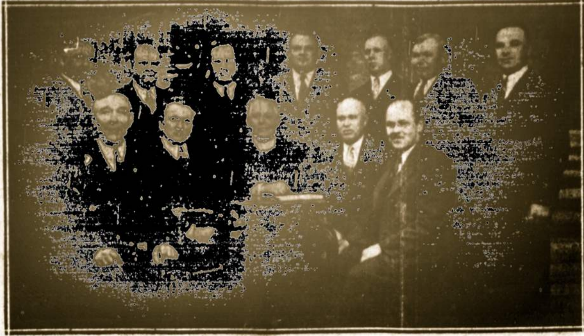
VILNIUI VADUOTI SĄJUNGOS SKYRIUS, PITTSTON, kurs rengia Vasario 16-tos paminėjimą Casino Ballroom svetainėje, North Main Street.

Dabar eina LRKSA jubiliejinis vaju—geriausia programa įsirašyt, kurie da nepriklause.