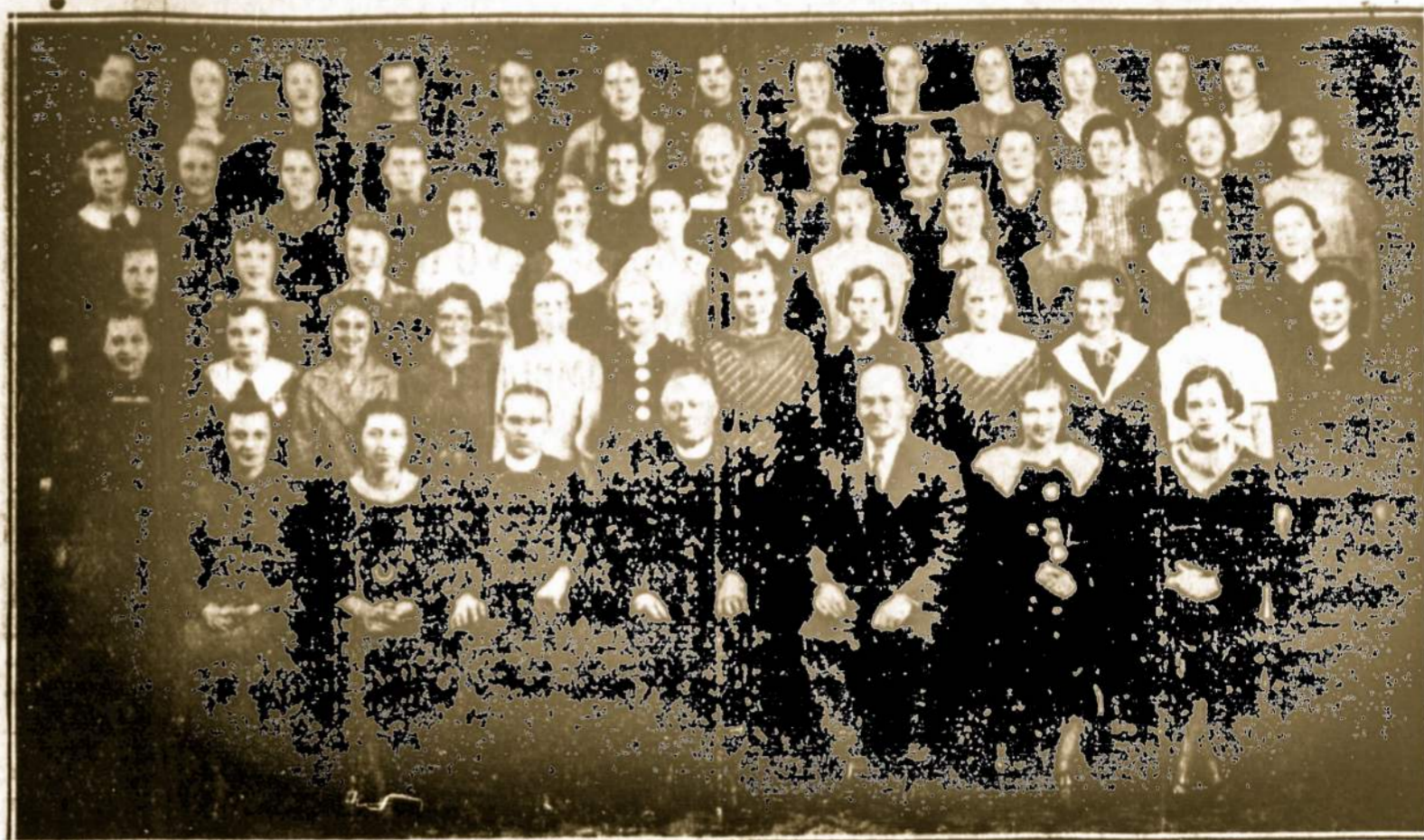
PITSTON, PA., SV. AGNIETĖS CHORAS. dalyvaus Lietuvos Nepriklausomybės paminėjimo programoj vasario 16-tą, Casino Ballroom svetainėj, No. Main St.

3315 SUPERIOR AVE. (1404 E. 66th St.), CLEVELAND, OHIO Telephone Henderson 6716