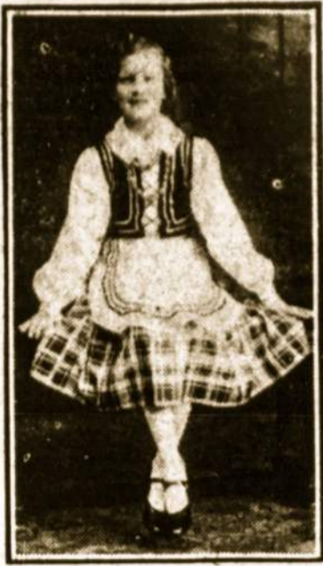
BIRUTĖ KAZAKEVIČIŪTĖ, pasižymėjus deklamtorė. Vasario 16-tą deklamuos pritaikintas eiles Pittstone ir Wilkes-Barre.

Po programai bus linksmi šokiai iki vėlybos nakties. Įžanga visiems 15c.