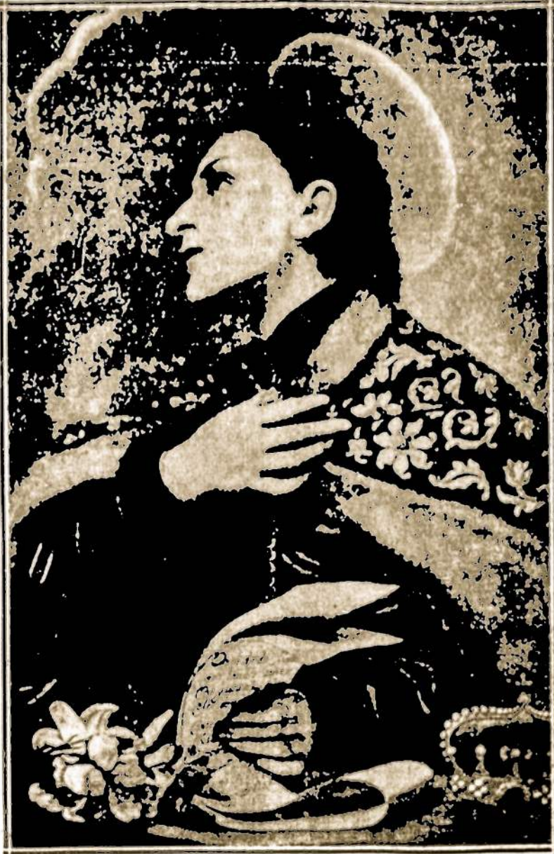
SV. KAZIMIERAS—LIETUVIŲ TAUTOS GLOBĖJAS Kovo 4-tą iškilmingai švenčiama jo šventė