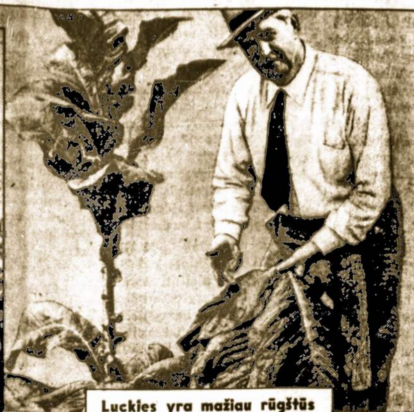
Luckies yra mažiau rūgštūs