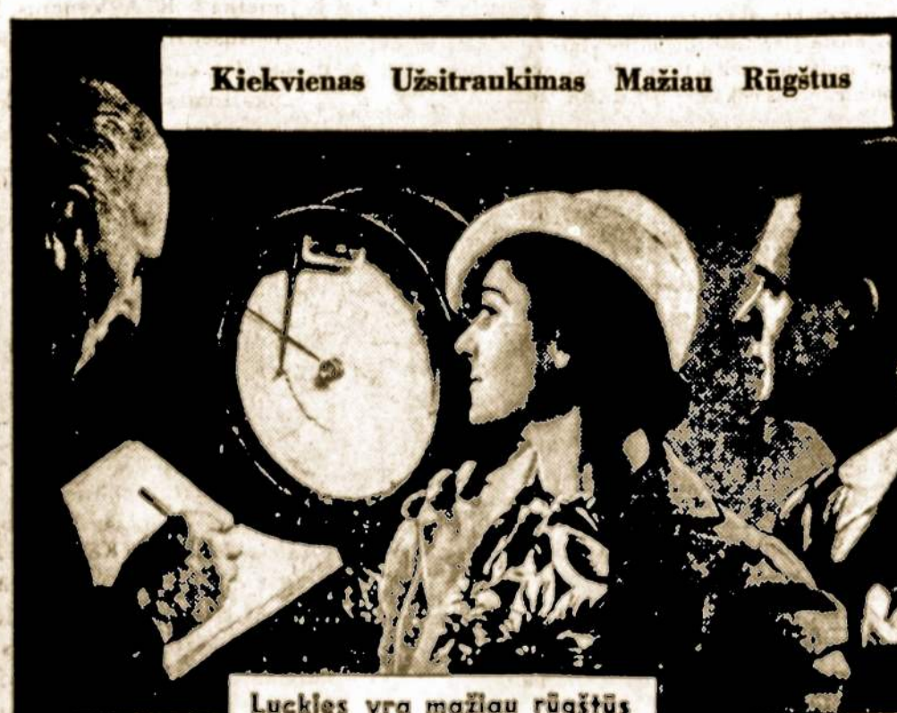
Kiekvienas Užsitraukimas Mažiau Rūgštus

Svarbiausia atskira cigaretų savybe, išskiriant patį tabaką, yra tai drėgnumo kiekis. Jo įtkei priklauso galimumas pagaminti vienodus cigaretes, kontroliuoti degimą ir valdyti dūmų kokybę. Drėgnumo perviršius kliudo tinkamam degimui, ir padaro cigareto dūmus neskoningais. Drėgnumo nedateklus leidžia sausiams, dulkėtiems cigareto dūmams susidurti su delikatomis gleivėtomis rūkytojo plėvėmis.