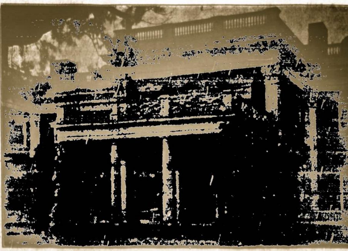
MARIJANAPOLIO KOLEGIJOS ROMAI, THOMPSON, CONN.

"GARSAS" 73 EAST SOUTH STREET (P. O. Box 38) WILKES-BARRE, PA.