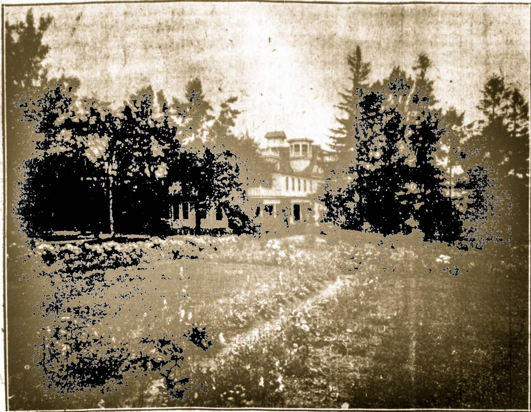
NUKRYŽIUOTO JEZAUS SESERŲ VIENUOLYNO IRNASLAITYNO RŪMAI, ELMHURST, PA. Rugsėjo 6-tą (Darbo Dienoje—Labor Day) Sans-Souci Parke rengiama Wyoming Klono 24-ji Diena, kurios pelnas eis vienuolyno ir našlaityno naudai.