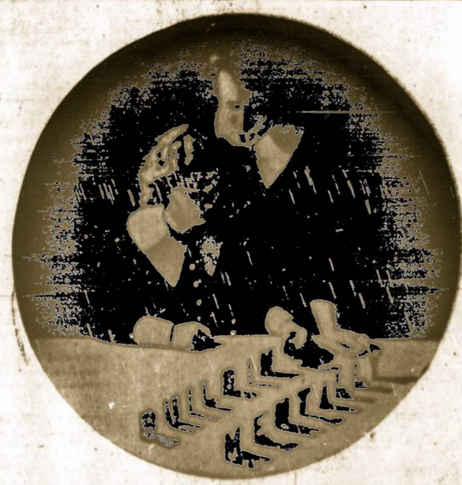
Pittsburgh, Pa., Sv. Pranciškaus Akademijoje auklėtinės ikyje aukštę protinį išsilavinimą.