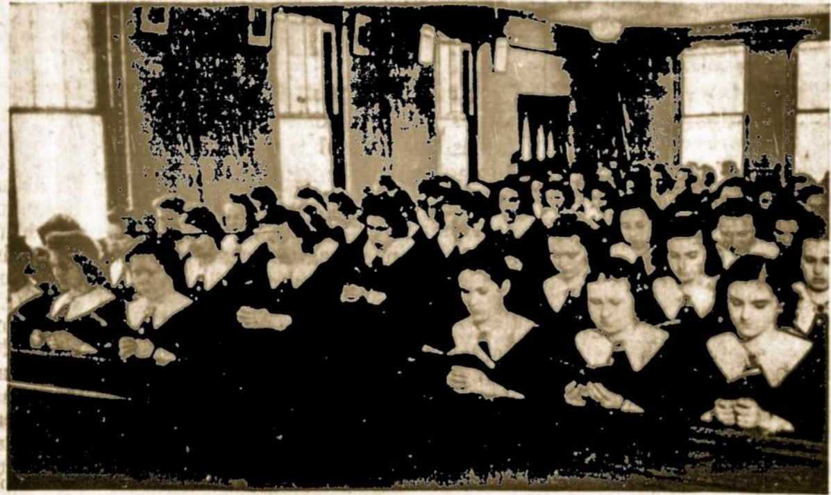
Pittsburgh, Pa., Sv. Pranciškaus Akademijos auklėtinės meldžiasi