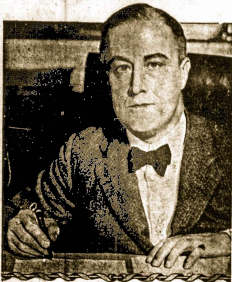
PREZIDENTAS F. D. ROOSEVELT, Vyriausias U. S. Ginkluotų ir Visų Jėgų Vadas