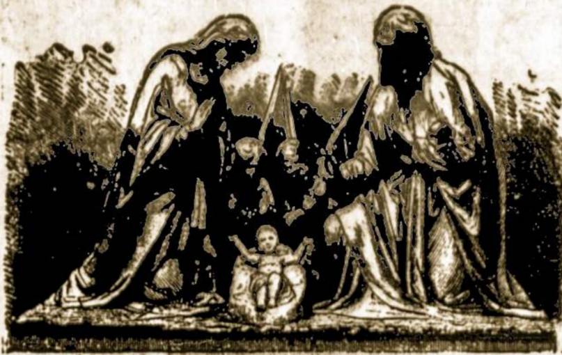
Sveikas, Jėzau Mažiausias, Kūdikėli Brangiausias...

— Sveiki mes. Dievui dėkui už metus praėjusius. O jie svetur kažin ar jau prigijo? Gal skurstą, kaip žiedeliai, kur šaltuose vėjuose? Na, iš tyros širdies už juos po "Sveika, Marija".