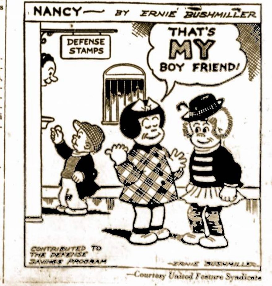
CONTRIBUTED TO THE DEFENSE SAVINGS PROGRAM