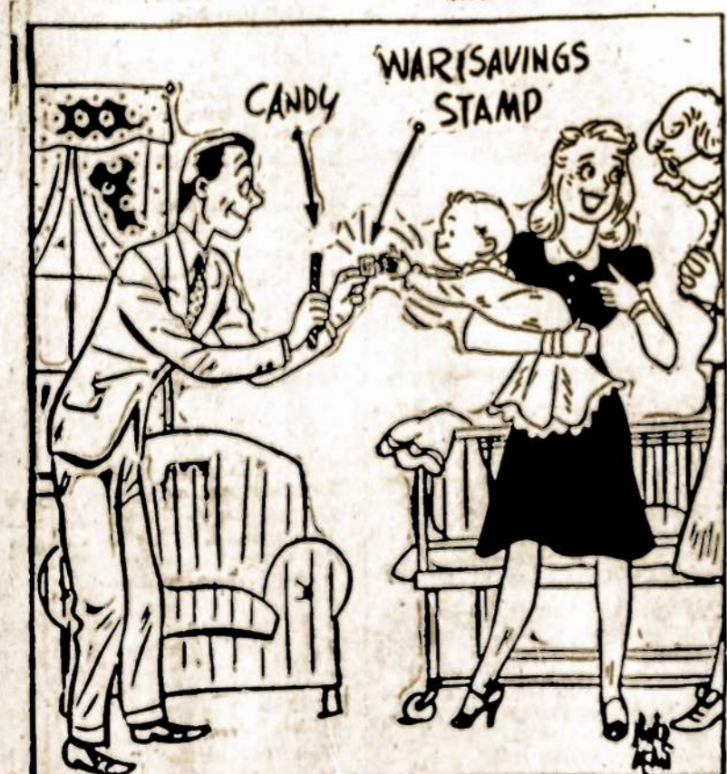
"Junior catches on quick!"

For Victory... Buy U.S. DEFENSE BONDS AND STAMPS