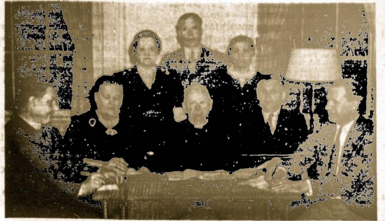
53-JO SEIMO RENGIMO KOMITETAS