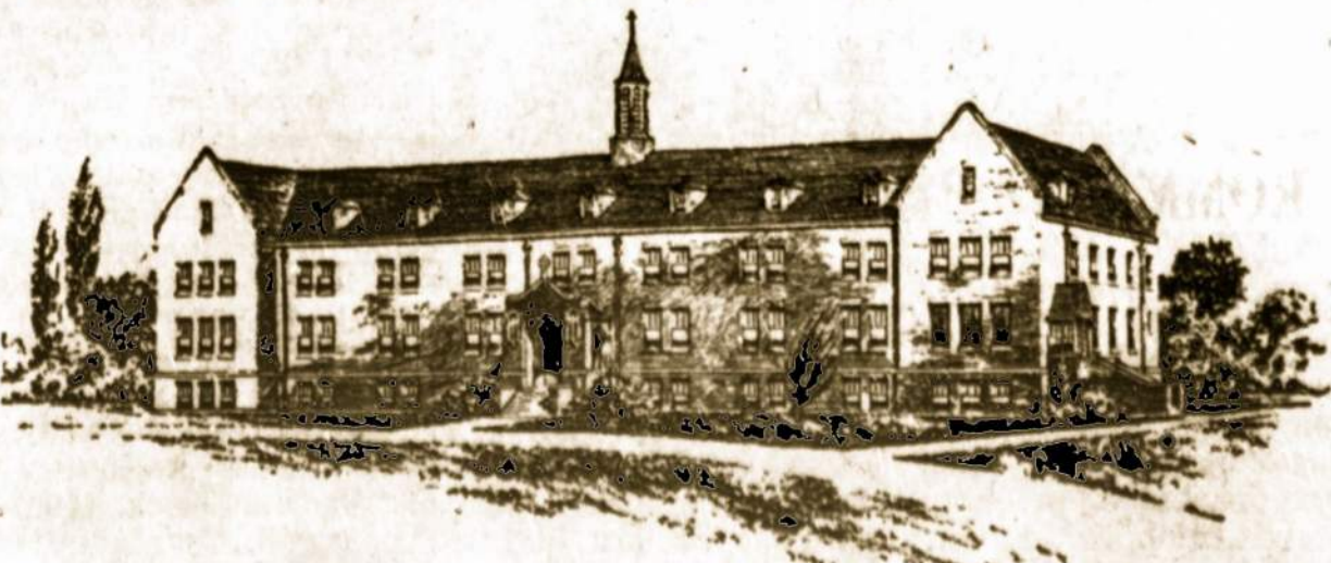
Sv. Pranciškaus Vienuolynas Dievo Apvaizdos Kalne, Pittsburgh, Pa., Sv. Pranciškaus Vienuolyno Rėmėjų pastangomis pastatytas 1925 m. ir iki šiol jų užlaikomas.

šinerijos stiprinimo disbdami fabrikuose ir ūkiuose. Lavalis sako, kad už tris prancūzų darbininkus bus paliuosuotas iš nazių nelaisvės vienas prancūzas karys. Suprantama, tokie mainai Hitleriui labai naudingi. Jis gaus tris darbininkus vietoje vieno kariškinio nelaisvio, kurį turi maitinti. Bet ar Lavalui pavyks prancūzų darbininkus numstinti Hitlerio vergijon—parodys netolima ateitis.