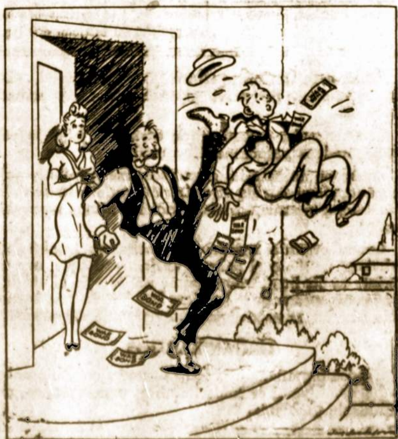
"Wait! On second thought you ought to make a good son-in-law!"