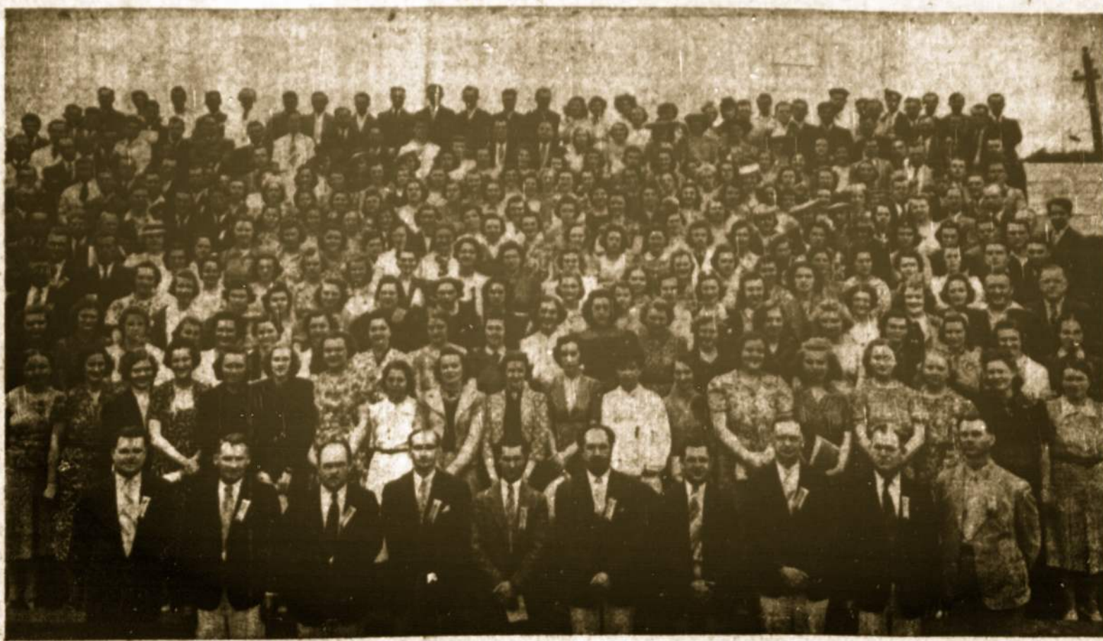
JUNGTINIS WYOMING KLONIO LIETUVIŲ ROMOS KATALIKŲ PARAPIJŲ CHORAS