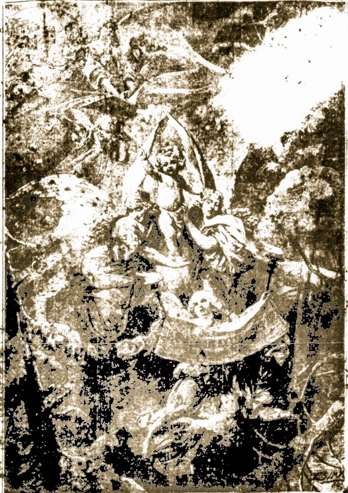
Angelai, kurie danguje, kalbia išganytoja Bėdėjui: "Dovydūmies, lyje, menkame tvirtelyje, gimai ir mirties"

Šiandien, gruodžio 20 dieną, šventės progą nuosirdžiai sveikiname LRKSA viršius, kuopus viršininkus, narius, "Marso" skaitytojus ir rėmėjus linksmųjų malonių svenčių.