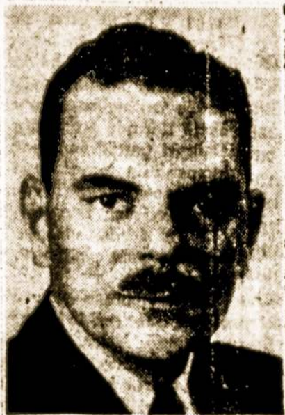
THOMAS E. DEWEY