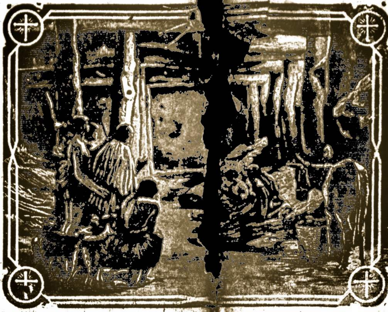
TYLIA NAKTI, SVENŲA, NAKTI GIMĖ DIEVAS IR ŽMOGUS...

Toje pačioje šalyje buvo piemenų, kurie budėjo ir sergėjo per naktį savo bandą. Štai Viešpaties angelas atsistojo prie jų, ir Dievo skaitumas apšvietė juos. Jie labai nūsigando; bet ang-las jiems tarė: Nebijokite! Nes štai aš skelou jums didelį džiaugs-mą, kurs bus visai tautai, kad šiandien jums gimė Dovidio mieste Išganytojas, kurs yra Kristus, Viešpats. Ir tai bus jums ženklas, rasite kūdikį suvystytą vystyklais ir paguldytą prakarte. Ūmai atsirado prie angelo daugybė dangiškos kariuomenės, kuri gar-bino Dievą ir sakė: Garbė Dievui aukštybėje ir žemėje ramybė geros valios žmonėms! Angelams pasišalinus nuo piemenų į dan-gų, jie sakė vienas kitam: Nueikime lig Betleju ir pažiūrėkime to, kas įvyko, ką Viešpats yra mums apskelbęs: Jie atėjo skubū ciamiesi ir rado Mariją, Juozapą ir kūdikį paguldytą prakarte. Pamatę gi, jie skelbė tai, kas jiems buvo pasakyta apie tą kū-dikį. Visi, kurie tai girdėjo, stebėjosi tais dalykais, kurie buvo jiems piemenų papasakoti. Marija gi dėmėjosi sau visus šiuos dalykus ir svarstė juos savo širdyje. Piemenys sugrįžo atgal, garbindami ir šlovindami Dievą dėl viso, ką buvo girdėję ir ma- tė, taip kaip jiems buvo pasakyta.