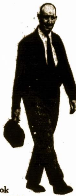
Negaišuok DARBLAIKIO su PEČIUGELA

Raumeninę pečiųgėlą greitai palyginkit su Johnson'o PEČIUGELIŲ PLEISTERIU—beveik tas pats, ką dėvėtum šildančia paduškaite. Jis veikia trejopai: (1) Atgabena šildantį, gydančią kraują į skaudamą vietą. (2) Gelbsti nuvargusių raumenims—sumažina skausmą/sūgius. (3) Planelinę paduškaite palaiko šilumą per valandą valandas. Pirkit Johnson'o PEČIUGELIŲ PLEISTERIŲ, pagamintą Johnson & Johnson—patikimiausias vardas chirurgiškų aparataus gamyboje. Gaunamas visose vaistinėse.