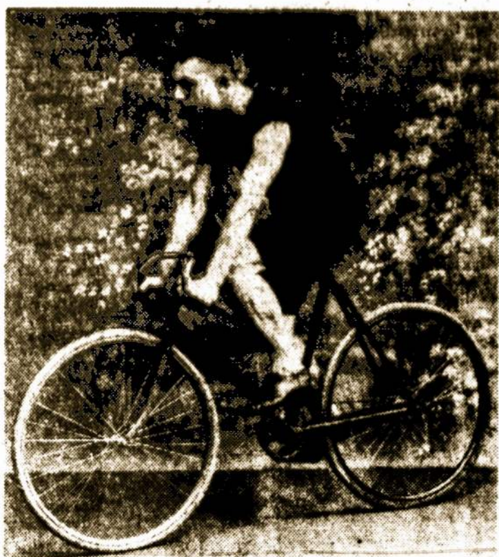
"LITTLE JOE" RICE IN CHAMPIONSHIP POSE IN 1896

(This article and cut is reprinted by courtesy of the Wilkes-Barre Record.)